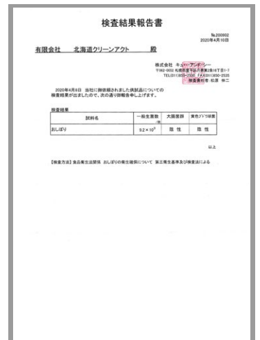
【検査方法】食品衛生法関係おしぼりの衛生確保について 第三衛生基準及び検査法による当店のおしぼりの検査結果